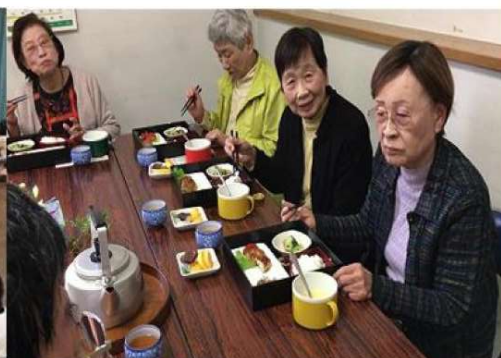
元気クラブ(追分南町内会)