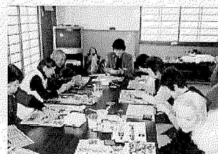
作品作り (ほのぼのサークル)