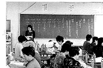
ボランティア研修会