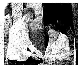
お誕生日友愛訪問