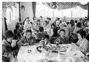
端午の節句 (ふれあいサロン)