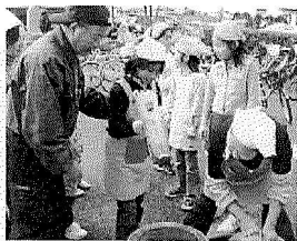
もちつき体験 (ふれあいサロン)

町内会との連携を図りながら運営し、町内の住民に福祉活動への理解を深めていただくよう努めます。