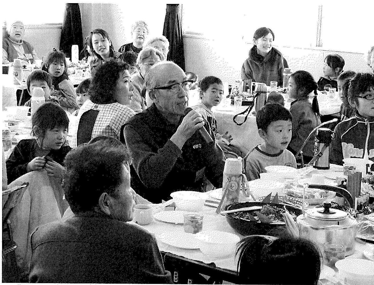
ひなまつりのつどい