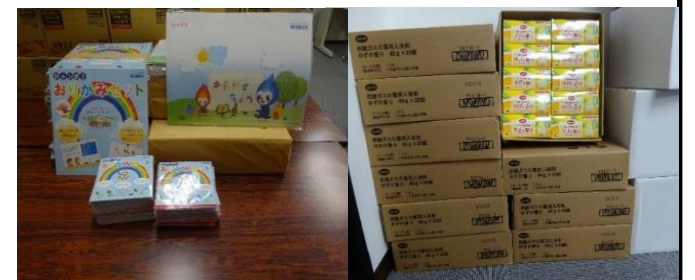
おりがみ(普通)おりがみ(大判)画用紙