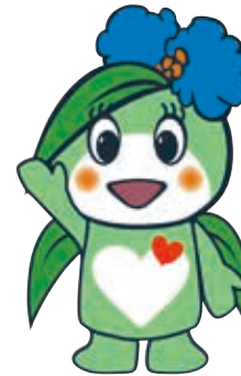
草津市社会福祉協議会 キャラクター 「ふくちゃん」

登録団体へのお問合せや ご依頼については、 草津市ボランティアセンターへ お問合せください。