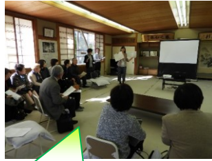
活動報告と交流会