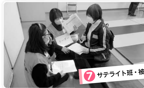
7 サテライト班・被災者役