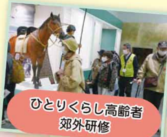
ひとり暮らし高齢者 郊外研修