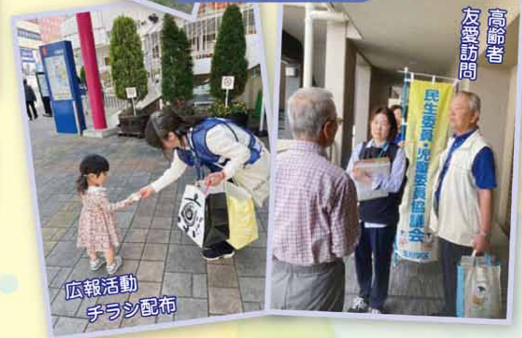
広報活動 チラシ配布