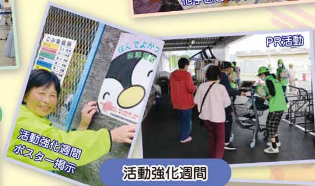
活動強化週間 ポスター掲示