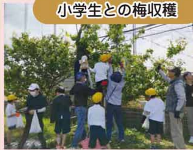
小学生との梅収穫