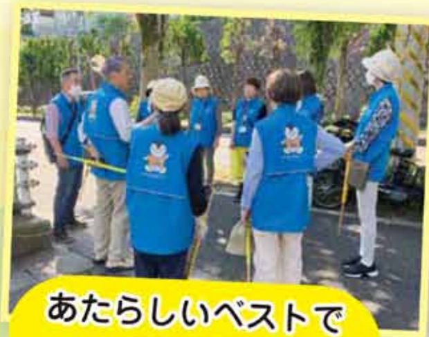
あたらしいベストで 啓発活動