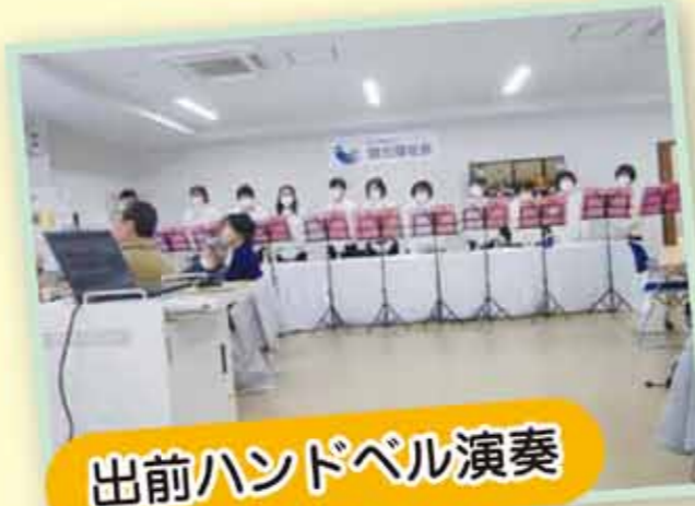
出前ハンドベル演奏